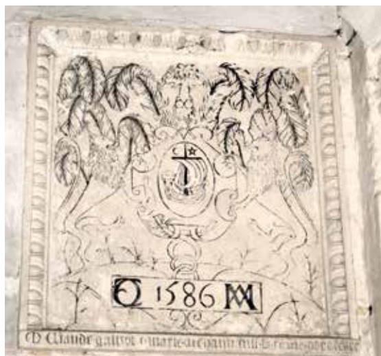
Plaque funéraire de Claude Galliot et de son épouse.

La tour porche d'inspiration grecque, à la toiture de pierre, aujourd'hui en très mauvais état, remplace en 1766 la flèche située au niveau du transept. Au XVIII e siècle, le chœur est reconstruit et une abside y est adjointe.