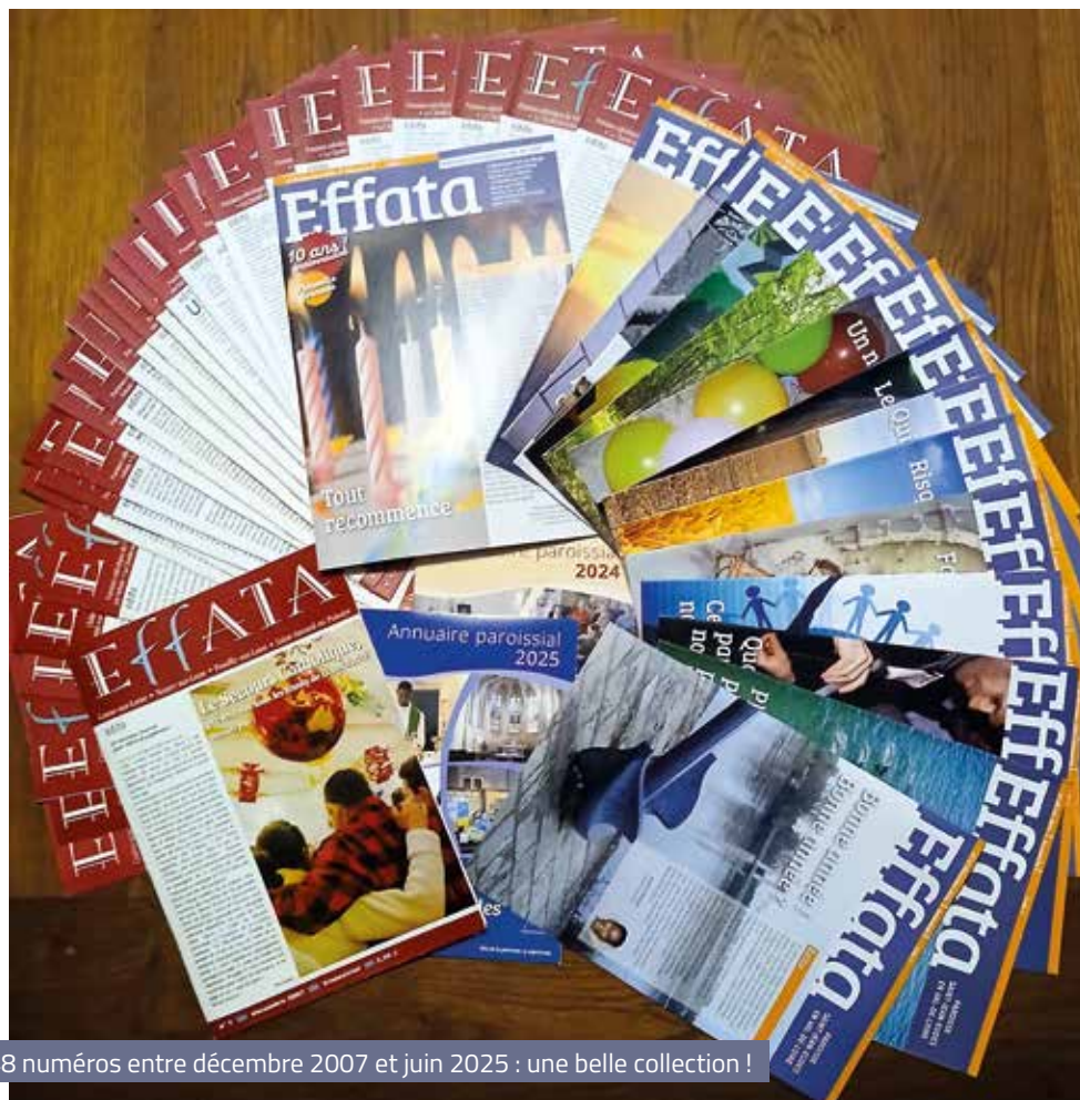
48 numéros entre décembre 2007 et juin 2025 : une belle collection !