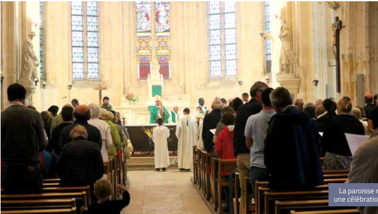
La paroisse réunie pour une célébration commune.