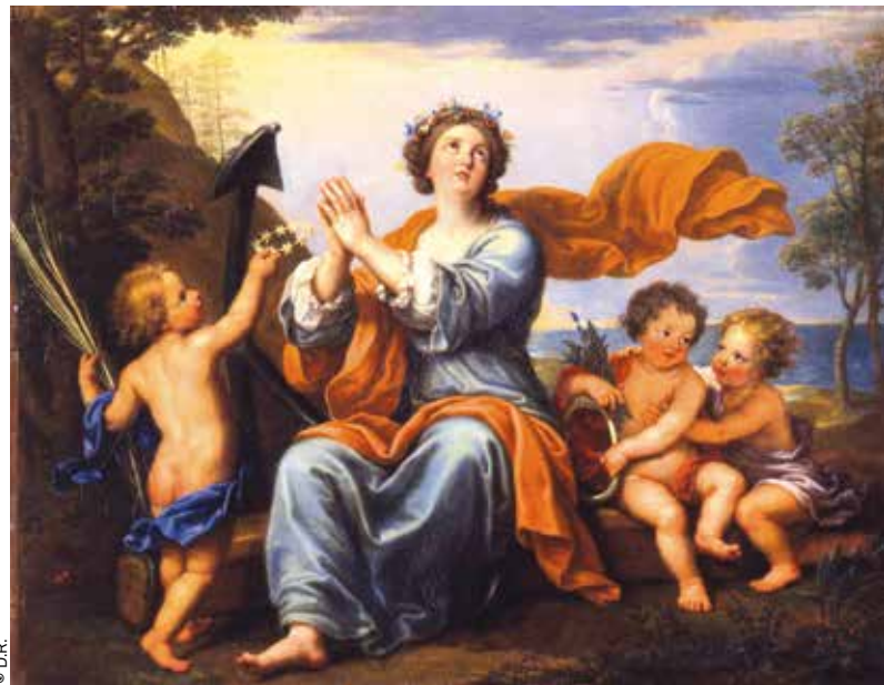
« Allégorie de l'espérance », de Pierre Mignard.